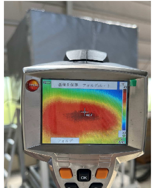
JacketFoam施工後 1300°C時表面41°C (After)