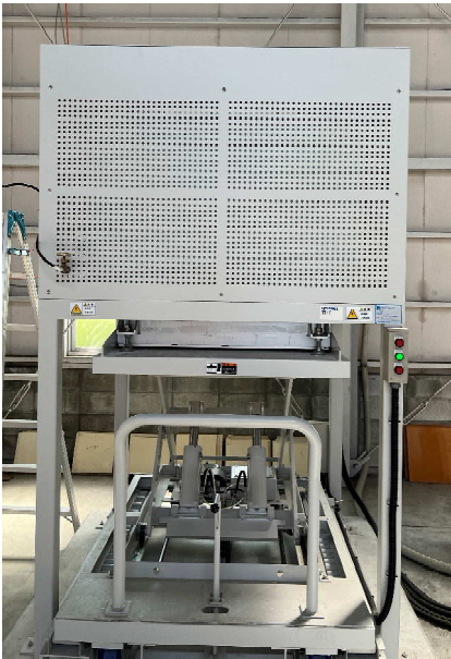
焼成炉 (Before) 焼成炉 (Before)